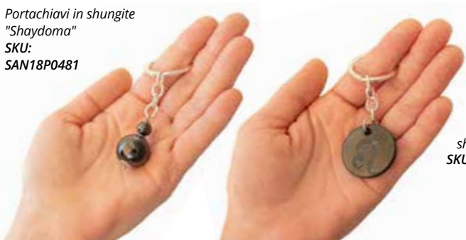
Portachiavi in shungite "Leone" SKU: SAN30G0405