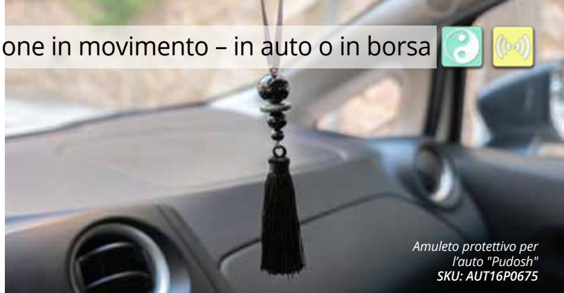
Amuleto protettivo per l'auto "Pudosh" SKU: AUT16P0675

Che sia in auto o al portachiavi, lo shungite favorisce l'equilibrio energetico, protegge dalle energie esterne e dona una sensazione di sicurezza – un accessorio elegante con effetto armonizzante.