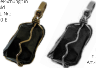
Halsanhänger Edel-Schungit in Silber Art.-Nr.: 071_E