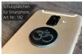
Schutzplättchen für Smartphone, Art.-Nr.: 182