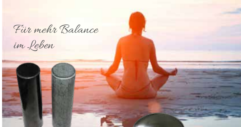
Schungit- und Talkchlorit-Zylinder-Set, poliert, Art.-Nr.: 073

Insbesondere für Menschen, die täglich hohen geistigen Belastungen ausgesetzt sind, können Schungit- und Talkchlorit-Gegensatzpaare eine wirksame Hilfe zur Balance der Kräfte Yin und Yang sein. So können wir unsere Energie besser und effektiver zu nutzen.