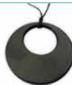
Halsanhänger „Hühnergott“, Art.-Nr.: 042_E