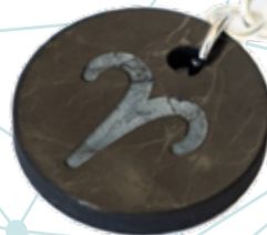
Schungit- Schlüsselanhänger mit Sternzeichen

Schungit ist ein starker Schutzstein. Die Größe spielt dabei eine untergeordnete Rolle. Bereits als Schutzamulett an Schlüsseln oder an einer Tasche kann der Stein seinen vollen Schutz entfalten. Schungit als Schlüssel- oder Taschenanhänger für unterwegs eignet sich perfekt für den Alltag.