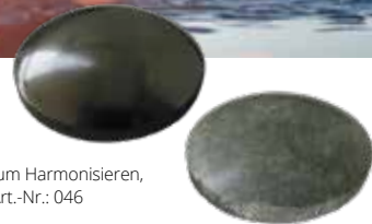
Linsen zum Harmonisieren, poliert, Art.-Nr.: 046

Schungit- und Talkchlorit-Zylinder werden zur Harmonisierung der Yin- und Yang-Kräfte angewendet. Der Schungit-Zylinder symbolisiert die weibliche Yin-Energie, der Talkchlorit-Zylinder die männliche Yang-Energie.