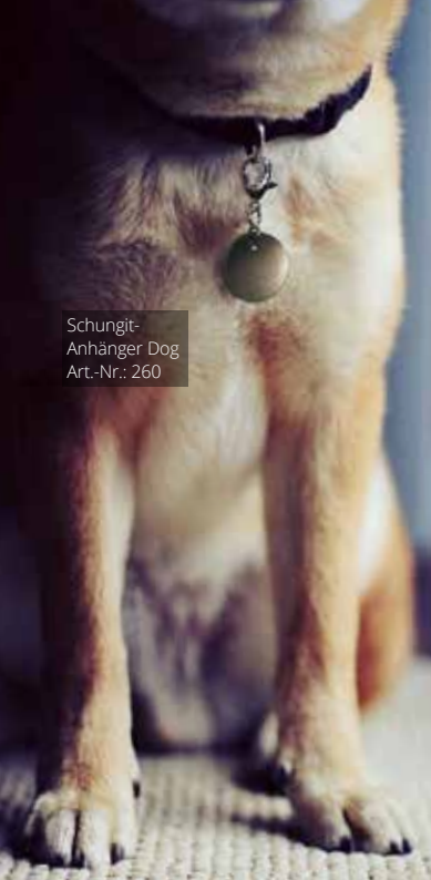
Schungit- Anhänger Dog Art.-Nr.: 260

Schungit-Anhänger Cat & Dog Art.-Nr.: 261