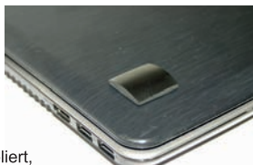
Schungit-Schutzplättchen, groß, poliert, viereckig, Größe: 25 x 25 x 5 mm, Art. Nr.: 162

Untere Fläche des Plättchens ist selbstklebend, so lässt sich der Stein einfach und sicher befestigen. Schungit kann einen dauerhaften, energetischen Schutz gegen die Einflüsse der negativen Strahlen bieten.