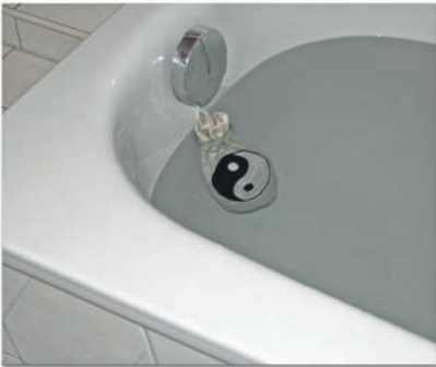
Schungit-Badezusatz, Yin-Yang, 300 g, Art. Nr.: 168

Eine energetische Reinigung, z. B. durch Sonnenstrahlen, ist auch zu empfehlen.