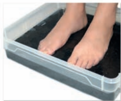
Schungit-Fußmassage Set Art. Nr.: 173

Schungit wird auch gerne für Energiebäder zur Tonus Steigerung benutzt. Für diesen Zweck können einzelne Steine oder auch kleinere Steine als Splitt verwendet werden. Splitt können Sie in einem Baumwollsäckchen in die Badewanne legen oder als natürlichen Splitt ohne Säckchen anwenden. Letzterer eignet sich besonders für Fußbäder. Nehmen Sie die positive Schwingung des Schungits auf, er gibt ihnen Kraft und Vitalität für den ganzen Tag. Bitte nehmen Sie keine Schungit-Bäder vor dem Schlafengehen.