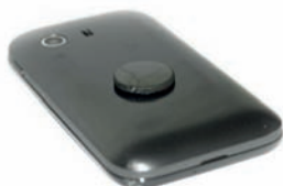
Schungit-Schutzplättchen, klein, poliert, rund, Größe: \varnothing 20 x 2,5 mm, Art. Nr.: 111

Der kleine Schungit Schutzstein eignet sich hervorragend zum Einsatz an Mobiltelefonen. Untere Fläche an dem Plättchen ist selbstklebend und kann sicher an einem Telefon befestigt werden. Die Funktion des Gerätes wird dadurch nicht beeinträchtigt.